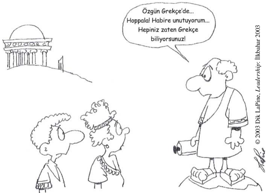
İlk asırda vaaz verme

Böylece, Luther'in sürekli olarak tekrarladığı gibi çarmıh, her zaman tamamen utanılacak bir şey olarak kalmalı. Çarmıh Yahudiler için, Tanrı'yı ahlâki gayret yoluyla arayan herkes için utançtı. Luther için çarmıh, insan işinin hiçbir şekilde insanlığı başarılı kılamayacağına ilişkin Tanrı yargısının açıklanmasıydı. Hiçbir inceleme veya çalışma insanlığı gerçekten bilge yapamazdı. Hiçbir insan çabası kalıcı sevinç sağlayamazdı. Özetle çarmıh, en temel insan putperestliğine, yani benliği Tanrı olarak görme eğilimine Tanrı'nın kalıcı olarak 'Hayır!' demesidir. Mesih'in çarmıhı, insanlığı, var oluşun merkezinde saygın bir yere koymak için gösterilen bütün çabaları mahkûm etmek için Tanrı'nın söylediği son söz olmuştur. ♦ (Ken Wiest, Chuck Faroe; çev. Ali Şimşek)