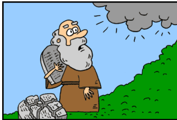
Roland Matthijssen'e teşekkürler (bkz. Çık. 24:12)