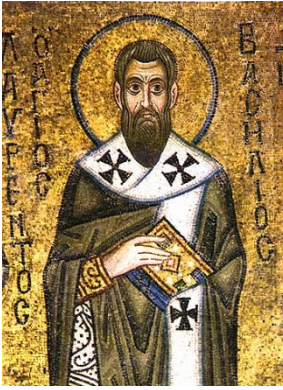
Büyük Basileos ikonası Kiev Ayasofya Katedrali

Çağrı olgusu her zaman Hristiyan kimliğinin merkezinde yer almıştır. Hristiyan topluluğuna girmek, İsa'nın ilk izleyicileri açısından, diğer kimliklerle kuvvetli gerginlik halindeki bir çağrıya ortak olmak demektir. Bununla beraber, Hristiyanlık Akdeniz dünyasında yayılıp imparatorluğun inancı haline geldikçe bu gerginlik hafiflemeye başladı.