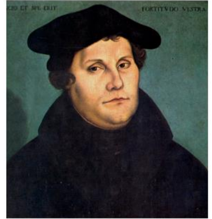
Martin Luther portresi İhtiyar Lukas Cranach, 1529

Ancak Luther, tüm Hristiyanların aynı görevleri yerine getirmeye veya aynı konumları işgal etmeye çağrıldığını söylemiyordu. Luther, insan Tanrı'nın lütfuna karşılık gelecek herhangi bir icrada bulunamayacak kadar aciz olduğundan dolayı, Tanrı'nın iyi işlerimize ihtiyacının olmadığını öne sürmüştür. Fakat komşularımız buna ihtiyaç duyar. Bu nedenle Tanrı her şeyi, herkesin Mesih'in bedeninin işlemesine katkıda bulunmak üzere kendine uygun göreve atanmasını sağlayacak şekilde, düzenlemiştir. İnsanları imanla Mesih'le bir kılan görev/çağrı